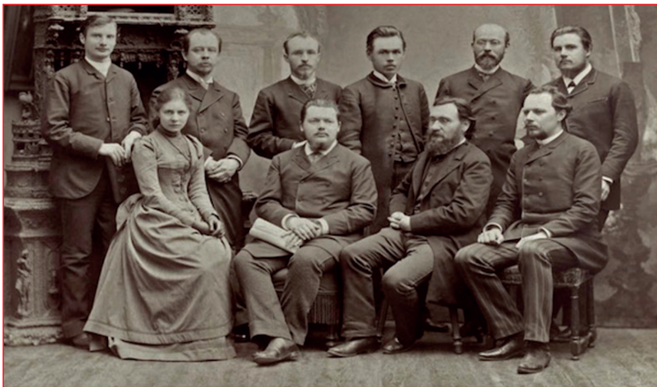
Fig. 2 - Photographie des membres du laboratoire de Metchnikoff à l'Institut Pasteur en 1890.